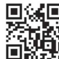
ペップトークとは

1984年~1985年 オリンピック・センター(コロラド・スプリングス) 1985年夏 NFL フィラデルフィア・イーグルス 1986年~2009年 NEC バレーボール部アスレティック・トレーナー 1989~1990年 全日本ジュニア・バレーボールチーム帯同トレーナー 1991~1992年 全日本バレーボールチーム (バルセロナ五輪) 2009~2010年 NEC レッドロケッツ メディカル・アドバイザー 2010年~現在 NEC レッドロケッツ・コンディショニングアドバイザー