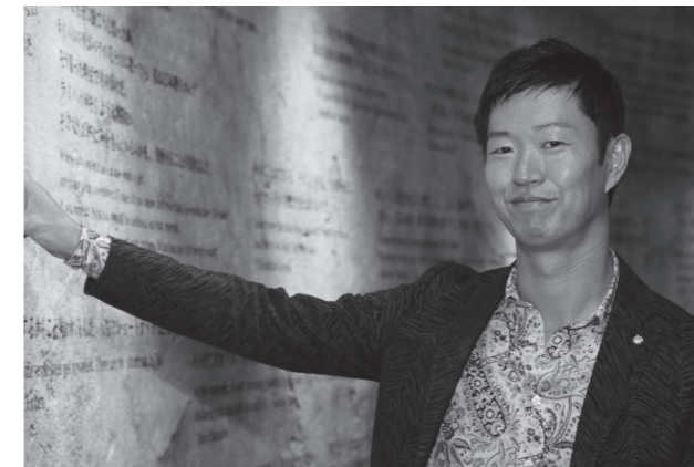
株式会社 Legaseed 代表取締役 CEO

これまで 650 社以上の組織変革を行い、 「クローズアップ現代」や「ワールドビジネスサテライト」など 多くのメディアにも取り上げられた新卒採用の極意を惜しみなくお伝えいたします。