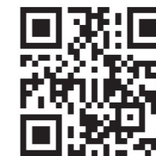
株式会社 Legaseed ホームページ

レガシードは、新卒採用支援に強い人と組織の成長コンサルティング会社です。会社の成長は、すべて人材に起因しているといっても過言ではありません。いくら優れたビジネスモデルがあっても、いくら具体的な経営戦略を立てても、それを実現するのは、「人」だからです。今いる社員、これから採用する社員、そして組織の器以上に会社を成長させることはできないのです。10年後も20年後もその先も、社会から必要とされる会社づくり。レガシードはみなさまのパートナーとして、人と組織の課題を解決します。 (ホームページより)